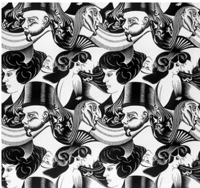
Werk van M.C. Escher

iets dat groter is: een heel lied, een shirt, een decor, een gebouw, een kunstwerk. En laten we daarbij vooral hetgeen in de natuur voorkomt niet vergeten.