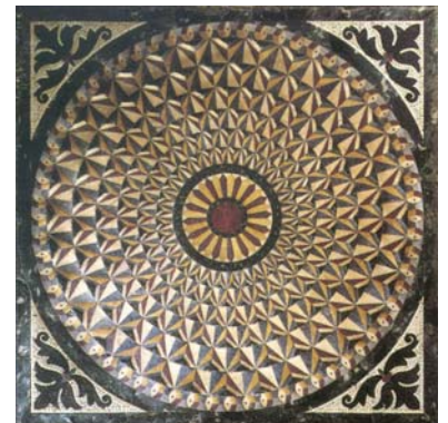
Vloer San Marco Venetië